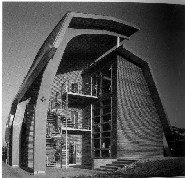
In copertina: Edifici sostenibili: nuova sede Velux a Kettering in Inghilterra. Articolo di Marco Imperadori a pag. 1076. Sopra e in copertina: Fotografia di Waterhouse Design.