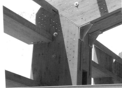
Uso innovativo del legno. Articolo a pag. 1086 di Ingrid Lavizzari.